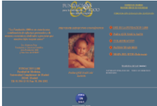
Carátula de la web de la Fundación 1000 ( www.fundacion1000.es ).

seguidamente: Radio: Radio Nacional, Radio Intercontinental (en dos ocasiones), Radio de Galicia, Cadena Ser de Burgos. Televisión: Antena 3, TVE, TV2 (en dos ocasiones), Informativos Canal Nou. Prensa diaria escrita: Revistas: Revista Ser Padres: Tu bebé, Embarazo Sano. Periódicos: El Mundo, ABC, Diario Médico, La Almudaina (Diario de Mallorca), La Opinión (de Murcia), Dominical de Gerona, Correo Farmacéutico, elemundosalud.com, Jano On-Line.